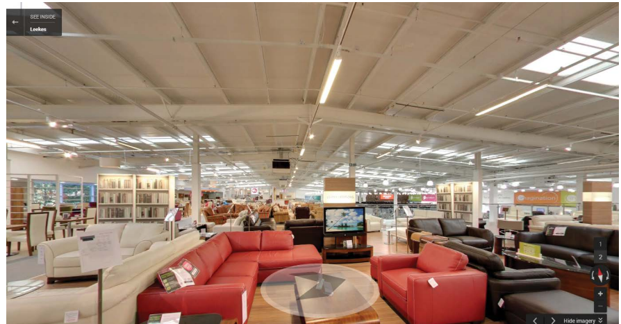
Business View en la tienda de Leekes en Coventry